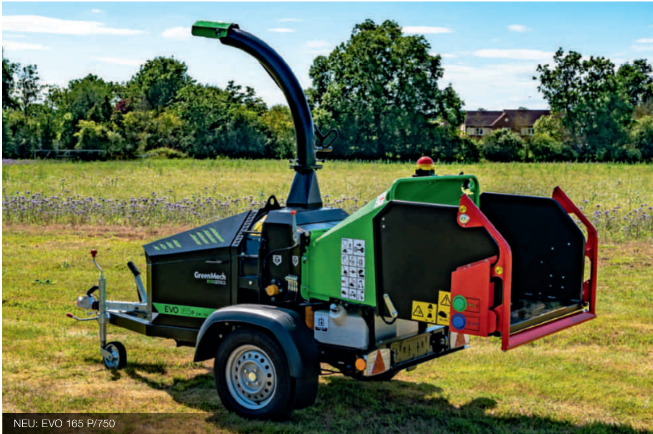
NEU: EVO 165 P/750

▶ MEHR BISS ▶ MEHR POWER ▶ MEHR DURCHSATZ