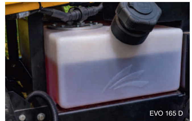
EVO 165 D

Rufen Sie uns an: +49 (0)2761 / 720 990-0 oder besuchen Sie unsere Website unter: www.greenmech.de